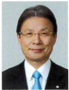
日本リハビリテーション 医学教育推進機構 理事長