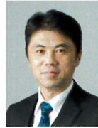
横浜市立大学 リハビリテーション科学 教授