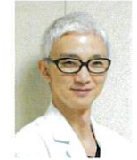
東京慈恵会医科大学 リハビリテーション医学講座 准教授