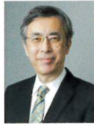
東京大学大学院 リハビリテーション医学 教授