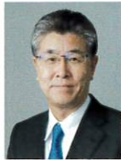
日本急性期 リハビリテーション医学会 理事長