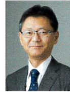
帝京大学 リハビリテーション科 教授