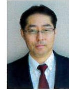
国際医療福祉大学病院 リハビリテーション科 教授